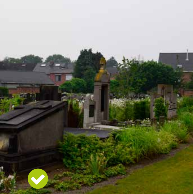
Aanplant met vaste planten en siergrassen.