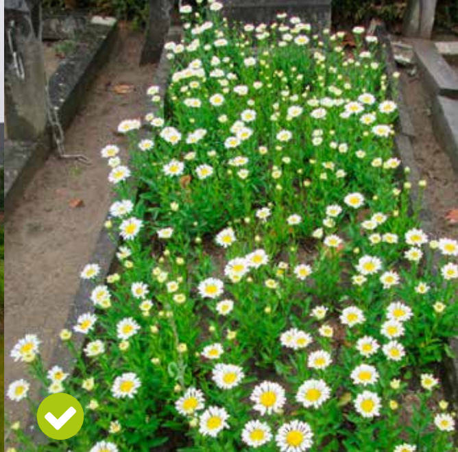
Creative invulling van de ruimte.