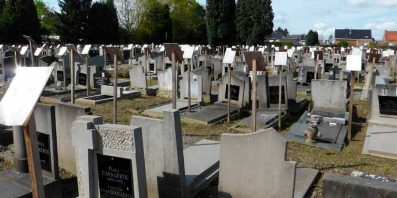
Ooit een grijze begraafplaats