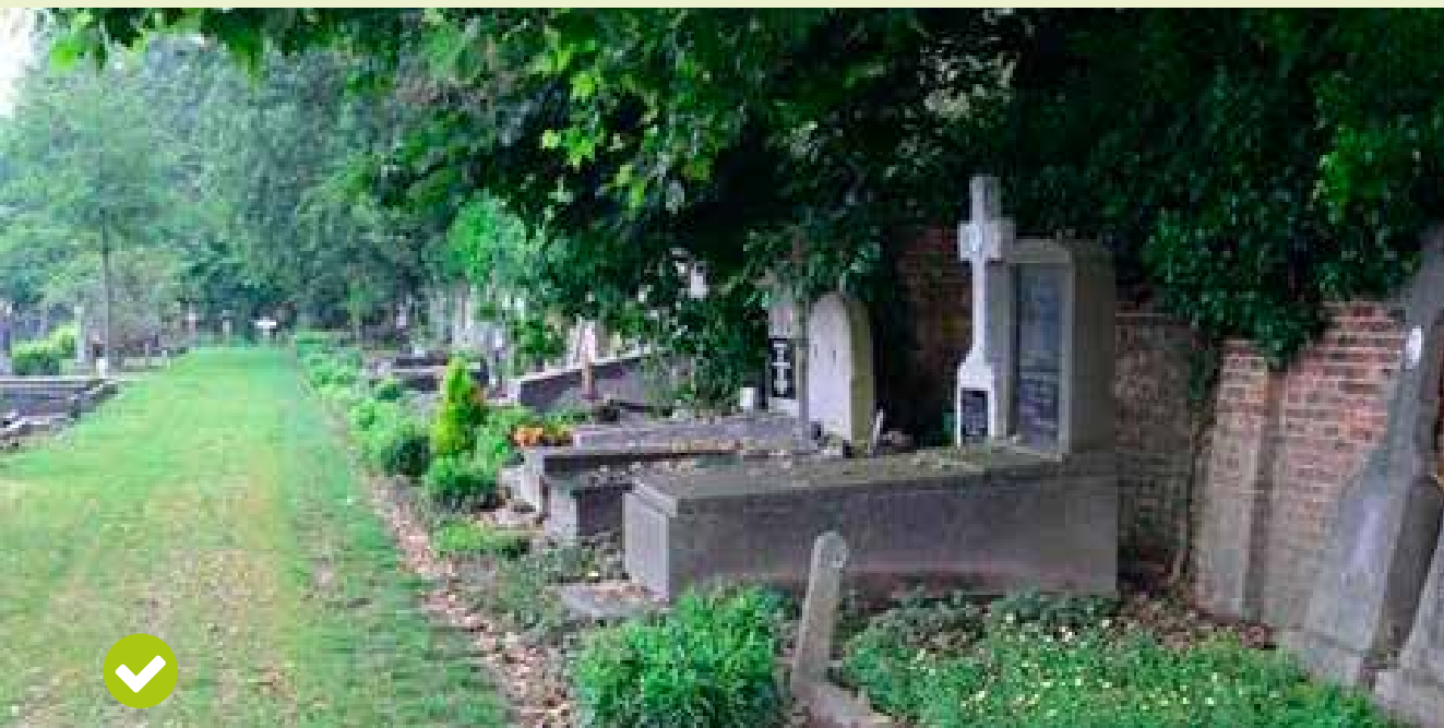
Bestaande kiezelpaden werden gemengd met teelaarde en bodemverbeteraar en daarna ingezaaid.